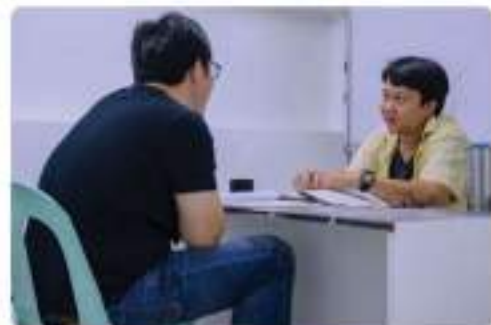
Man to Man Class

フィリピン人教師またはアメリカ人教師による、マンツーマンのクラスです。英語への自信と関心を高め、特に英語初心者におすすめです。