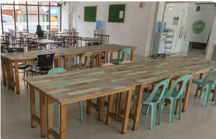
CAFETERIA & STUDY SPACES